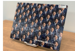
※画像はイメージです。 高橋一生 オリジナル・パズル